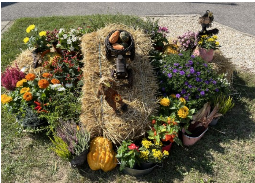
Eure Bürgermeisterin Ulli Kitzinger

Abschließend wünsche ich Ihnen allen einen schönen Herbst und den Kindern alles Gute für das neue Schuljahr.