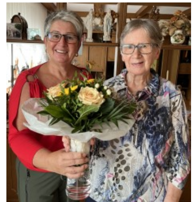
80. Geburtstag Kriegler